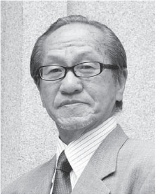
NPO法人京都観光文化を考える会・都草理事長