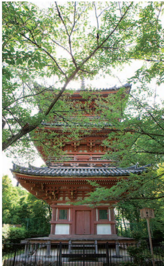
京都府大山崎町 宝積寺 重文 三重塔