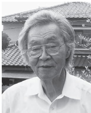
日本基督教団 八幡ぶどうの木教会牧師